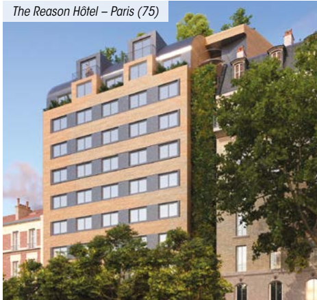
The Reason Hôtel – Paris (75)

*** Pour les non résidents seuls les immeubles détenus en France sont pris en compte.